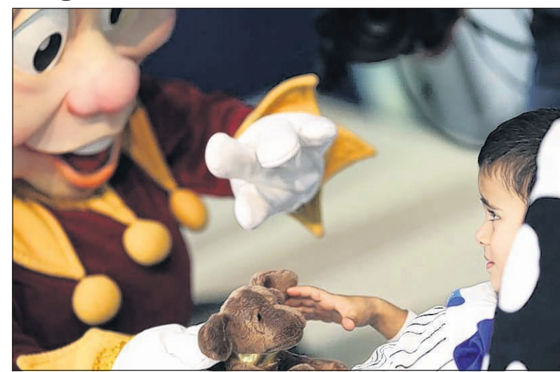
ROTTERDAM - Het was gisteren precies tien jaar geleden dat Villa Pardoos in Kaatsheuvel haar deuren opende. Sinds die tijd hebben ruim 3000 gezinnen met ernstig zieke kinderen genoten van een vakantie in de villa. Medewerkers en vrijwilligers bezochten daarom het Sophia Kinderziekenhuis in Rotterdam (foto) om zieke kinderen te verrassen.